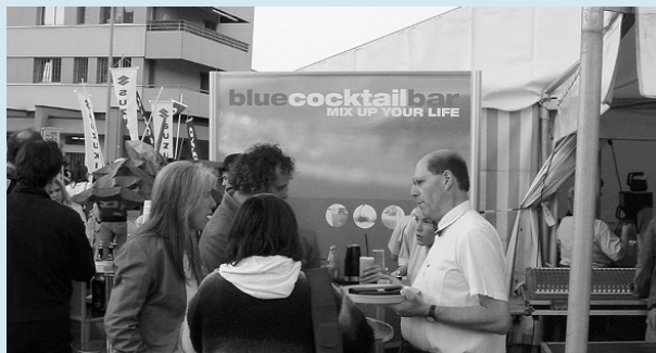
Sich verwöhnen lassen – auch das kann Kirche sein.

Am 29. September heisst es um 17.30 Uhr in der evangelischen Kirche Berneck, am 27. Oktober dann in Heerbrugg wieder «Auftakt – der Gottesdienst am Samstag abend». Die Planung für das kommende Jahr läuft, wir führen dieses Angebot sicher weiter. jlb