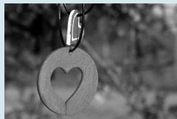
Ein «herziges» Amulett aus Laubsägeholz.